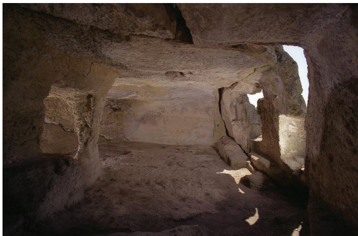
Рис. 11. Пещерный комплекс в районе Южных ворот. Предполагаемая церковь