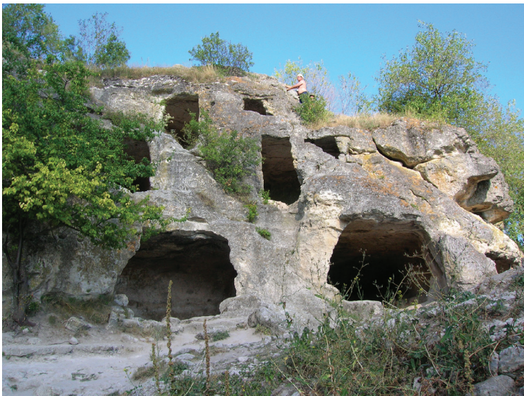
Рис. 8. Пещерный комплекс в районе Южных ворот (внутри крепостной стены). Восточная часть