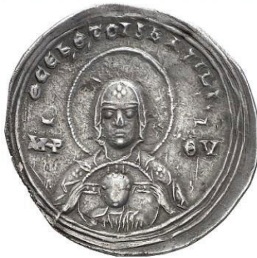
Рис. 2. Изображение Богоматери Никопеи на милиарисии Василия II и Константина VIII. Около 988 г.