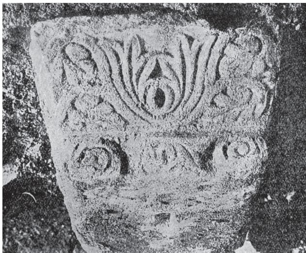
Рис. 3. Раннесредневековая мраморная капитель, найденная в кладке фонтана Газы-Мансура в 1927 г. Фото 20-х гг. XX в.