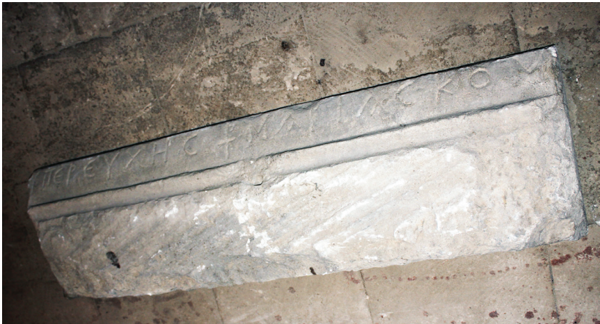
Рис. 6. Мраморная плита с надписью, найденная при раскопках беседки Селямет-Гирея