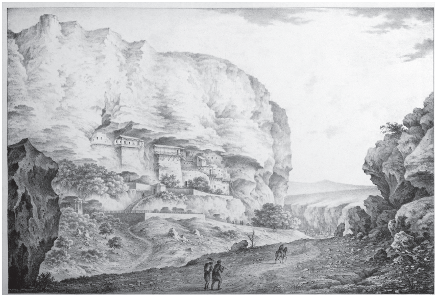
Рис. 13. Успенский монастырь. С литографии Ф. Гросса. 40-е гг. XIX в.