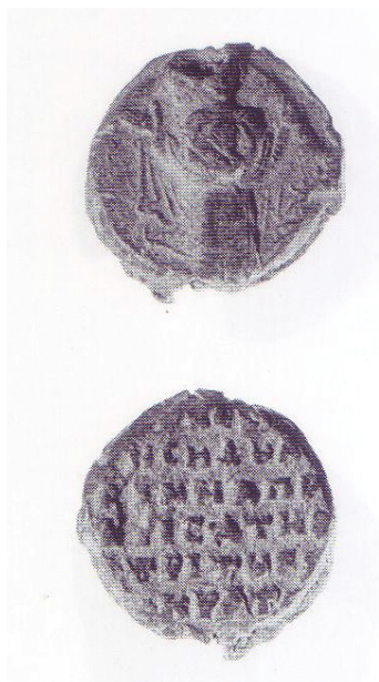
Рис. 4. Богоматерь Никопея в рост на печати дочери эксусиократора Алании Ирины