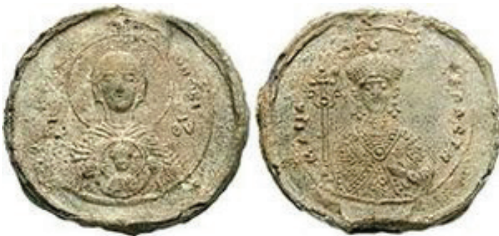
Рис. 3. Богоматерь Никопея на свинцовой печати императрицы Ирины Аланской. 1070-е гг.