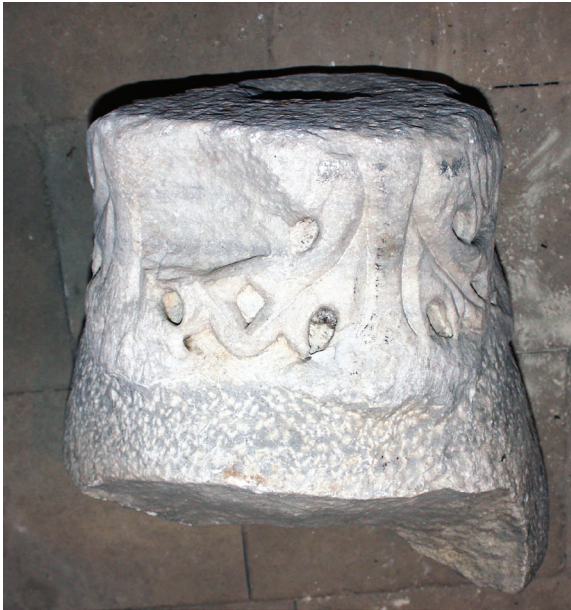
Рис. 5. Раннесредневековая мраморная капитель, найденная в 50-х гг. XX в.