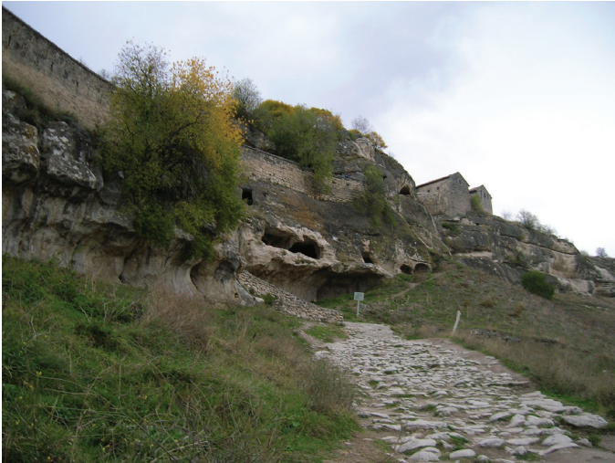
Рис. 7. Пещерный комплекс в районе Южных ворот. Вид с юго-запада