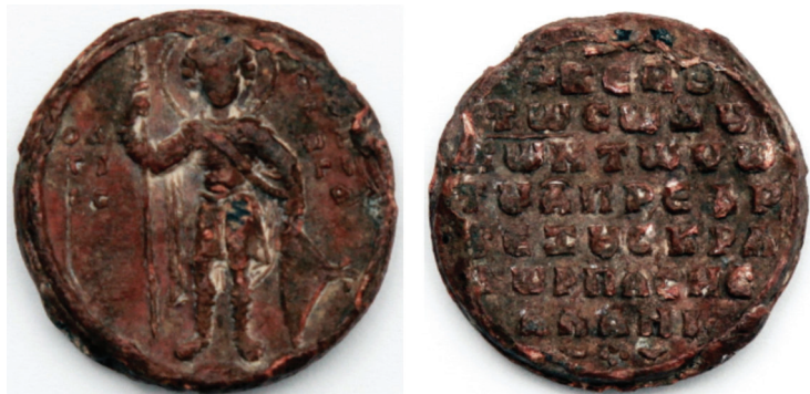
Рис. 5. Св. Георгий – небесный покровитель протопроедра и властодержца всей Алании Константина. 1068–1078 гг.