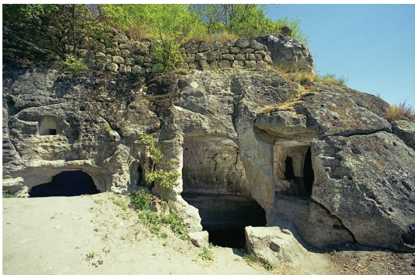
Рис. 10. Пещерный комплекс в районе Южных ворот. Вид на предполагаемую церковь