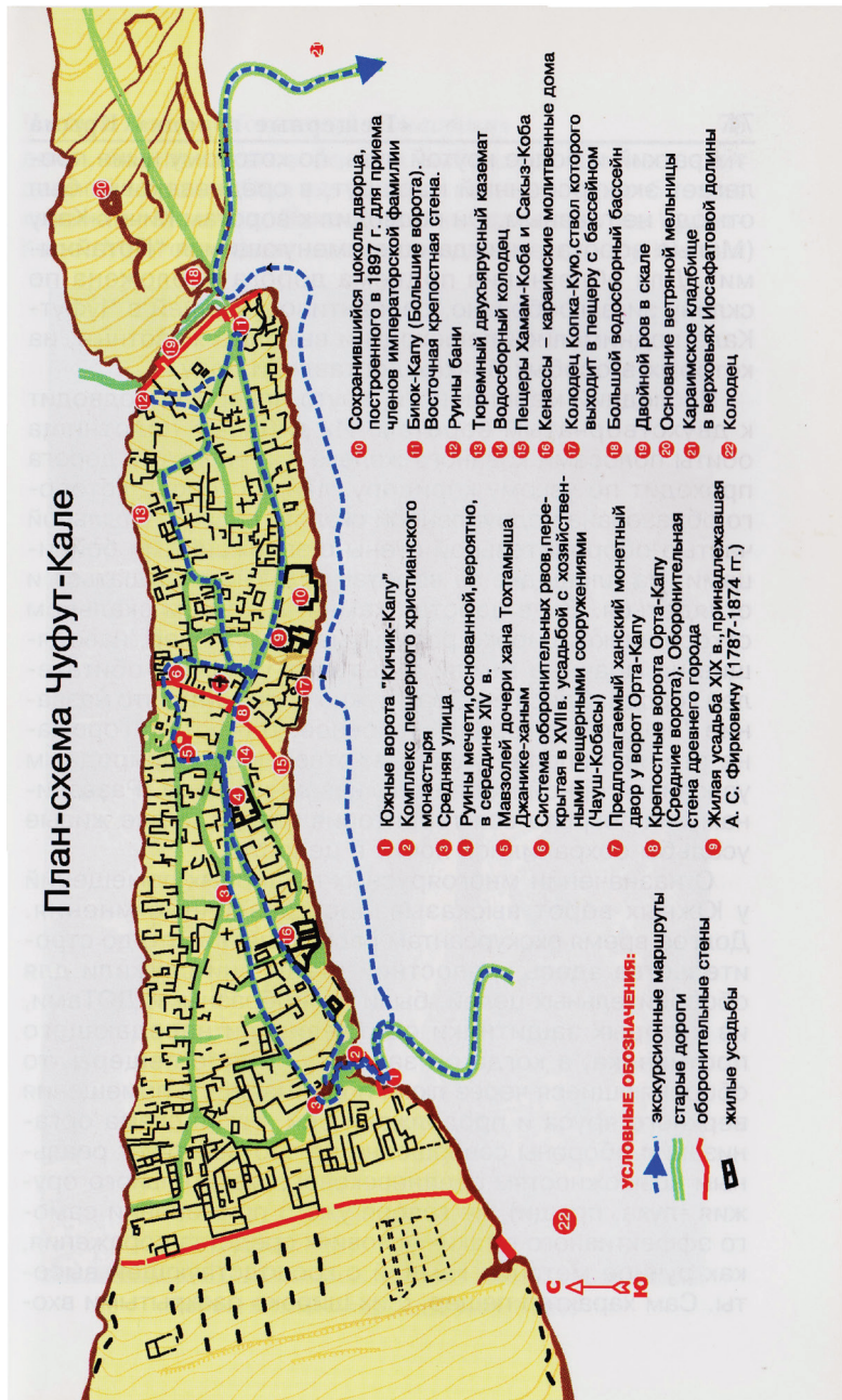
Рис. 2. План-схема застроенной части Чуфут-кале