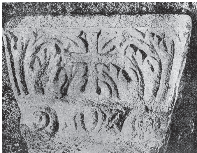
Рис. 4. Раннесредневековая мраморная капитель, найденная в кладке фонтана Газы-Мансура в 1927 г. Фото 20-х гг. XX в.