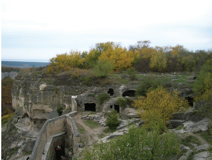
Рис. 9. Пещерный комплекс в районе Южных ворот. Вид с северо-востока