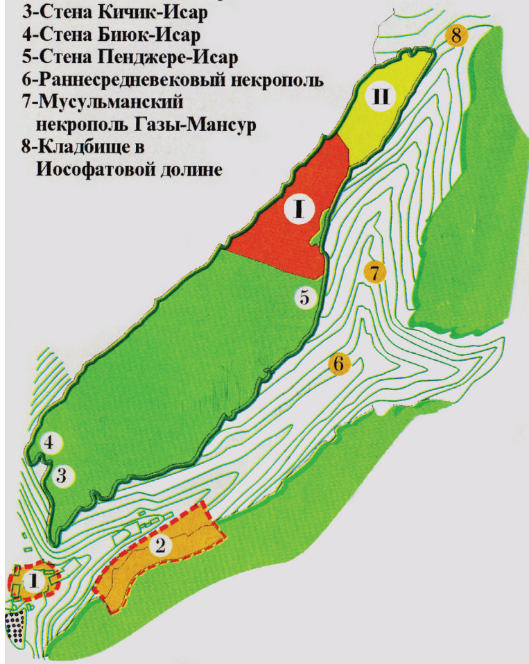
Рис. 1. План-схема расположения Чуфут-кале и окрестных памятников