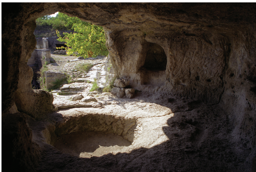
Рис. 12. Пещерный комплекс в районе Южных ворот. «Трапезная»