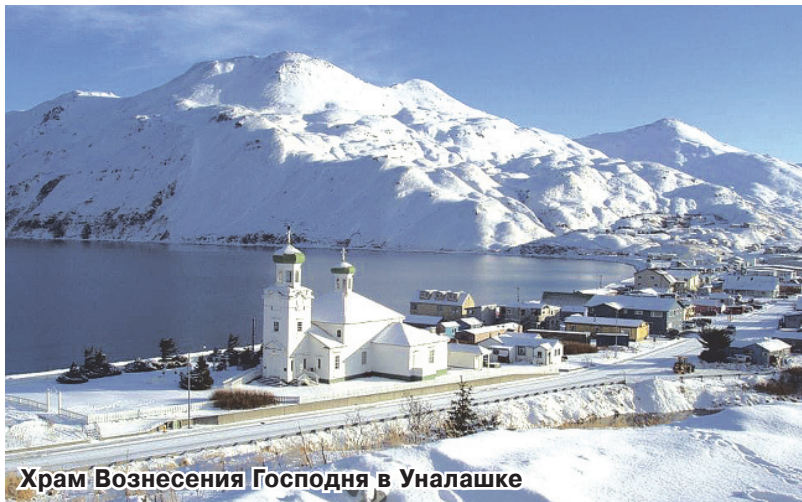
Храм Вознесения Господня в Уналашке

По возвращении из Америки в 1809 году в Санкт-Петербург Гедеон завершил, таким образом, свое кругосветное путешествие, растянувшееся на шесть лет. Миссия пастыря получила высокую оценку: он был наместником Александро-Невской лавры и архимандритом Троицкого Зеленецкого монастыря Петербургской епархии.