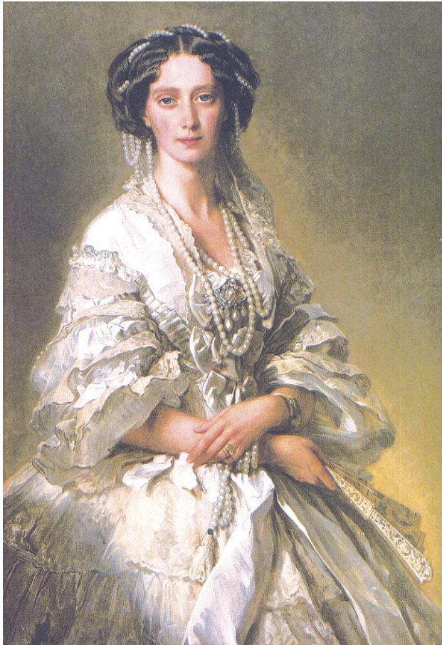
Императрица Мария Александровна – покровительница Общества восстановления христианства на Северном Кавказе

От имени государыни-императрицы Марии Александровны , «Высокой покровительницы осетинского народа», и от Общества восстановления христианства на Кавказе в Осетию присылались целые сундуки и большие ящики икон, облачений, колоколов и других принадлежностей православного Богослужения; сотни рублей рассылались специально на свечи, масло и вино для осетинских церквей («Русские миссии на окраинах. Кавказская миссия». И. Беляев, с. 232).