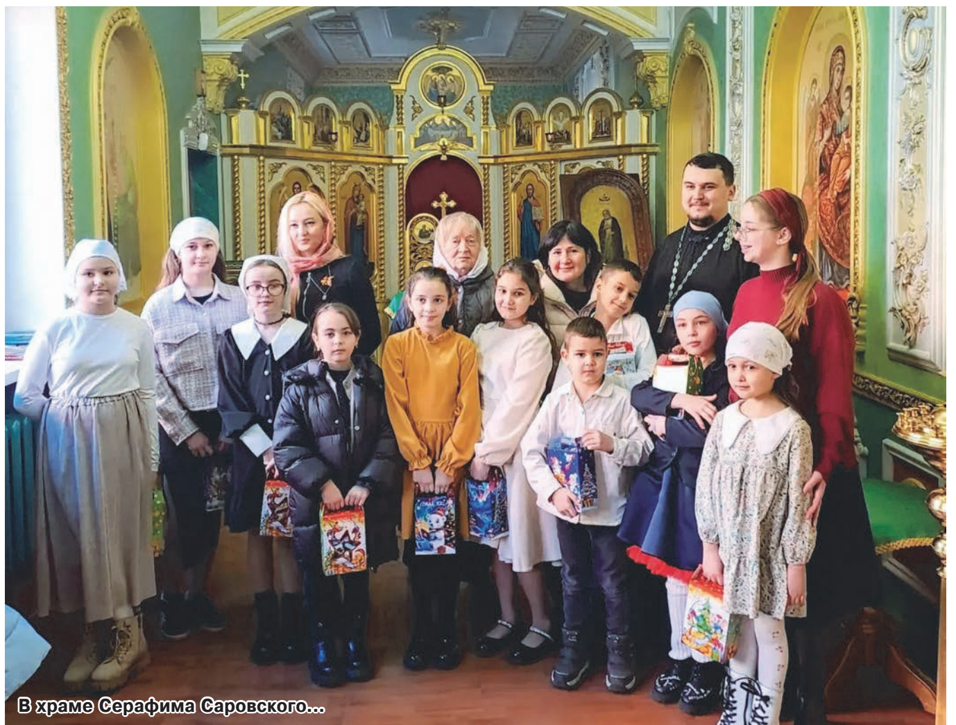
В храме Серафима Саровского...

ния для проведения занятий фактически не было: на выходные ученикам предоставляли небольшое старенькое помещение бухгалтерии. В любом случае было интересно, дети были такими жадными к православным знаниям. С 1993-го года школа стала активно развиваться, и поскольку наполняемость стала уже довольно-таки серьезной, пришлось делить ребят на группы по возрастам. Очень скоро