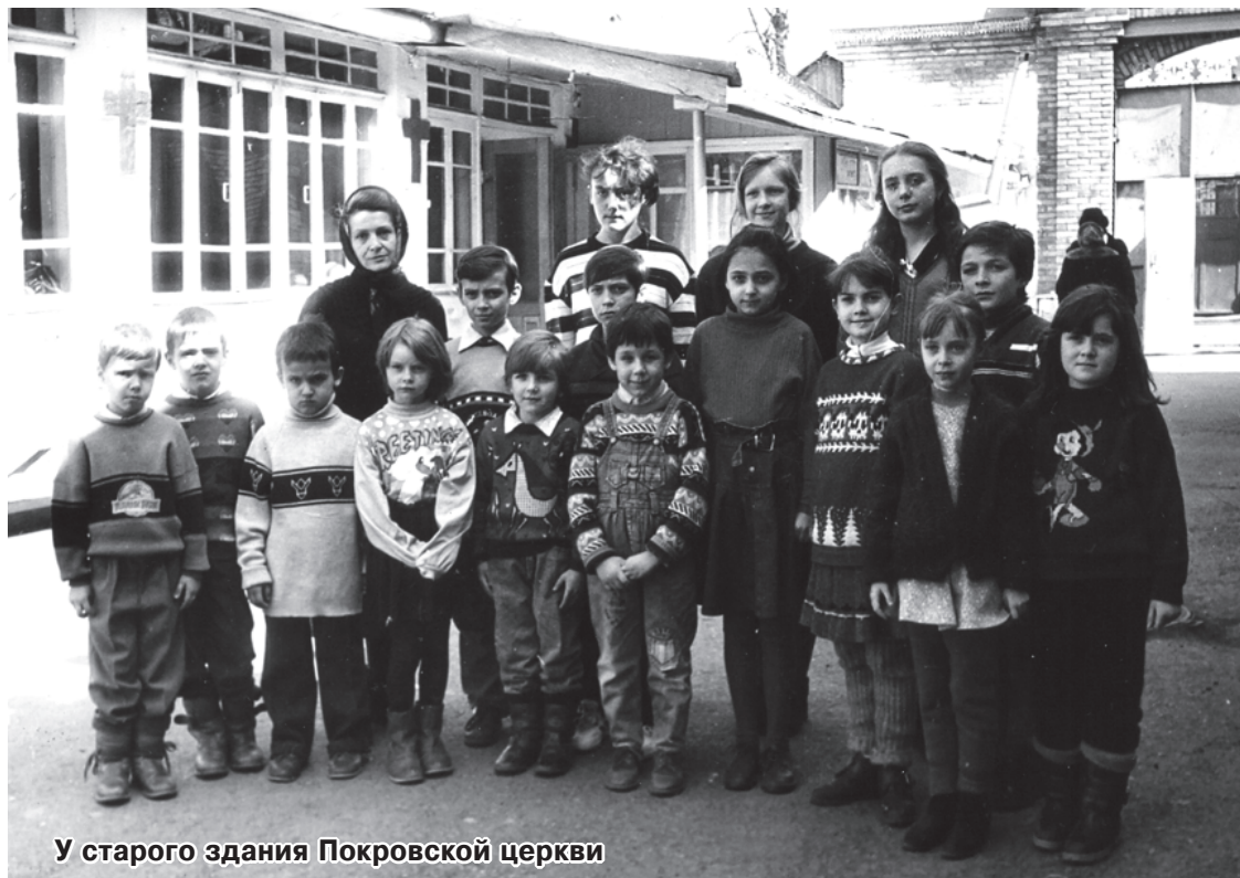
У старого здания Покровской церкви