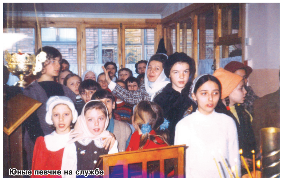
Юные певчие на службе

Тогда из Грозного привозили очень много раненых и без рук, и без ног тяжелых солдат. Мы раздавали крестики, поддерживали, как могли, дети пели им. И как-то вот у нас самих укреплялся дух, непосредственно касаясь и мира, и войны, и внося в это Божию Веру. Ребя-